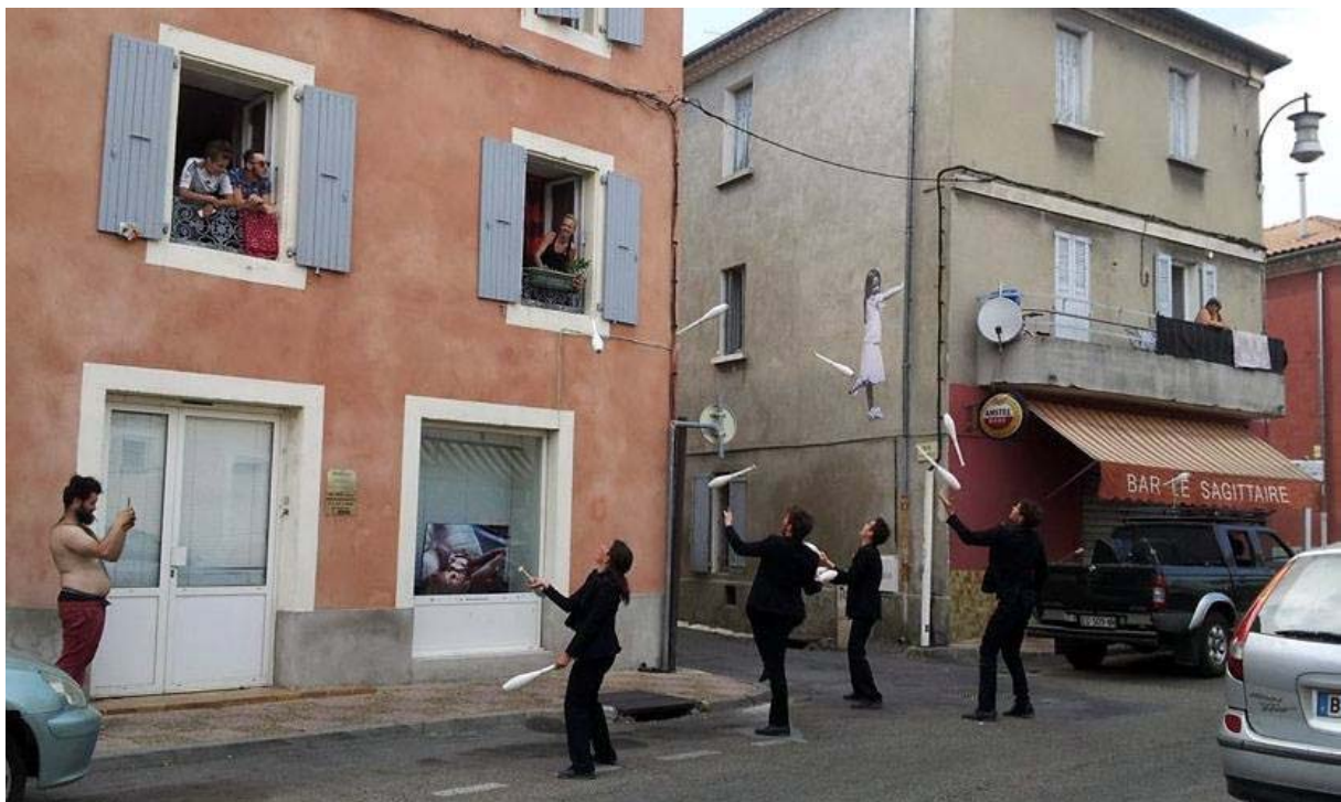
Collectif Protocole, One shot # 68 , INcircus avec La Verrerie d'Alès, 2017.