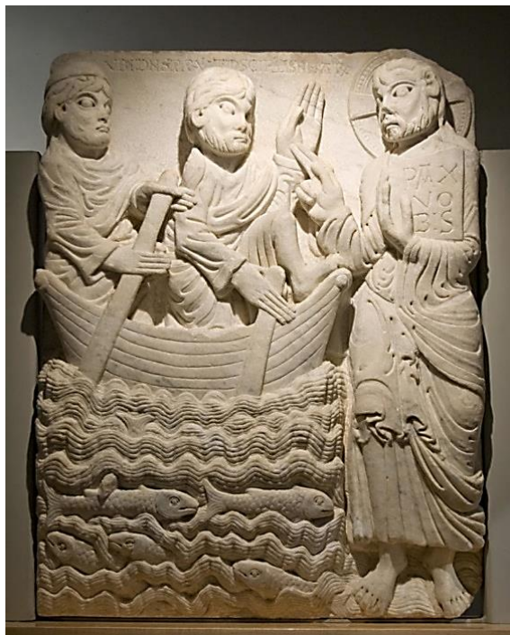
Relleu de la portalada de Sant Pere de Rodes (Alt Empordà). Conservat al museu F.Marès de Barcelona.

tot Gudiol el qualifica com un escultor revolucionari.